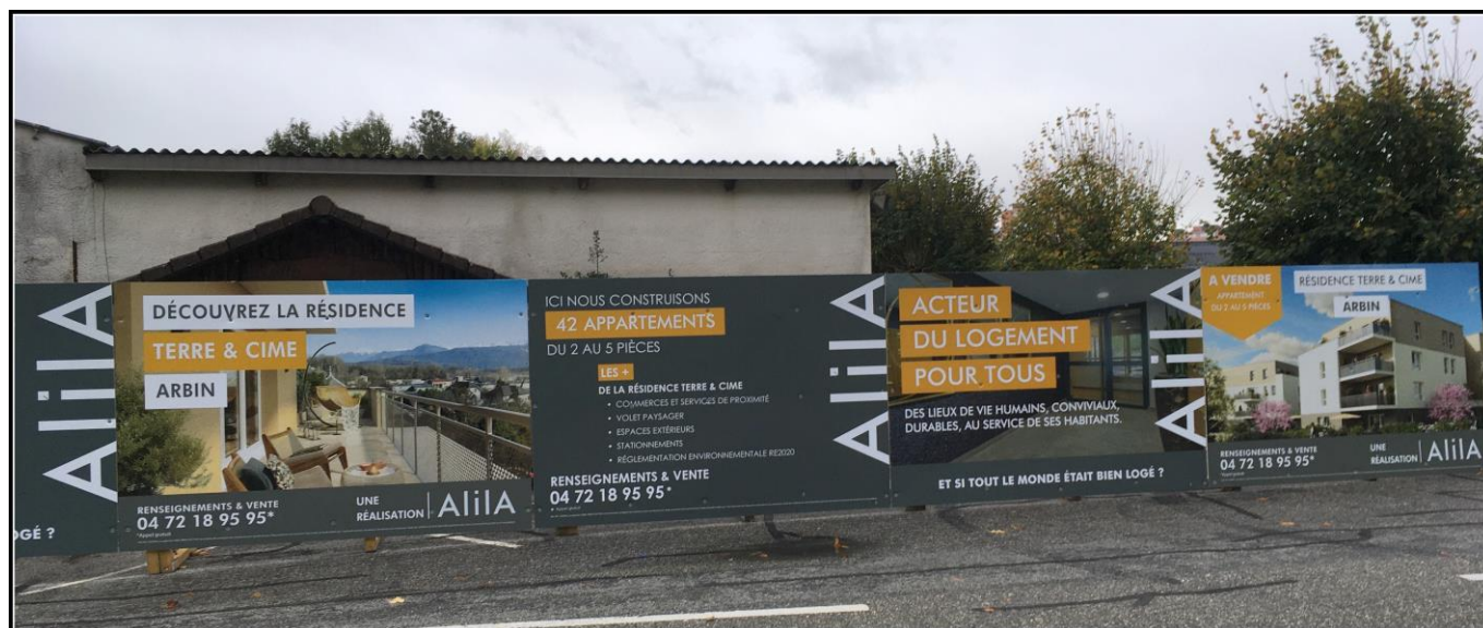
Panneau publicitaire installé en bordure de la salle des fêtes.

Toujours dans ce domaine de la communication, qui en agace plus d'un dans le village, j'en ai découvert tout dernièrement un exemple pour le moins surprenant. Sur le réseau social Facebook existe un site nommé : « Passion Montmélián » qui évoque la « petite et la grande histoire de nos Communes ». Entre autres choses, par ailleurs intéressantes, s'y trouve une publicité présentée par le Maire d'Arbin sur le futur ensemble immobilier qui devrait voir le jour à la place de notre salle des fêtes. Que doit-on penser d'une publicité publique sur un projet immobilier privé par un Maire sur sa Commune? A croire qu'il en est le promoteur ! Publicité déposée le 5 octobre, 10 jours après avoir demandé à son Conseil du 25 septembre le droit de prendre un avocat pour défendre la Commune face aux recours de tiers contre ce permis de construire.